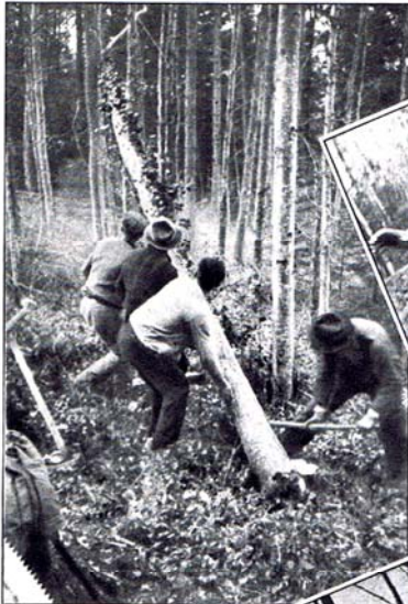
On abat, pour la fabrication du bois à carboniser, des arbres de mauvaise qualité.