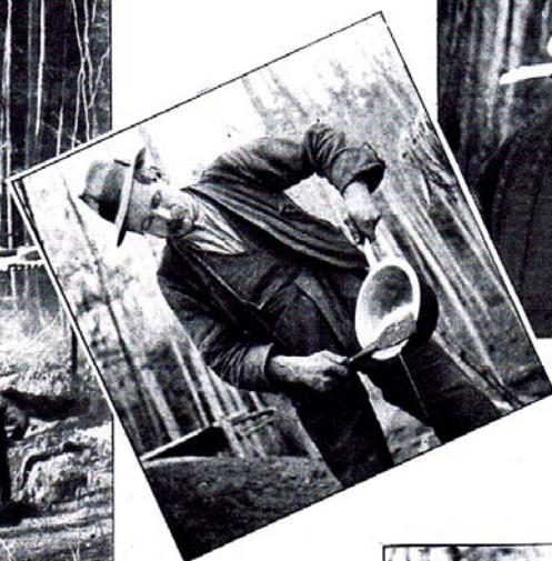
Ci-dessous : Le repas. Pour aujourd'hui, lard et macaronis.