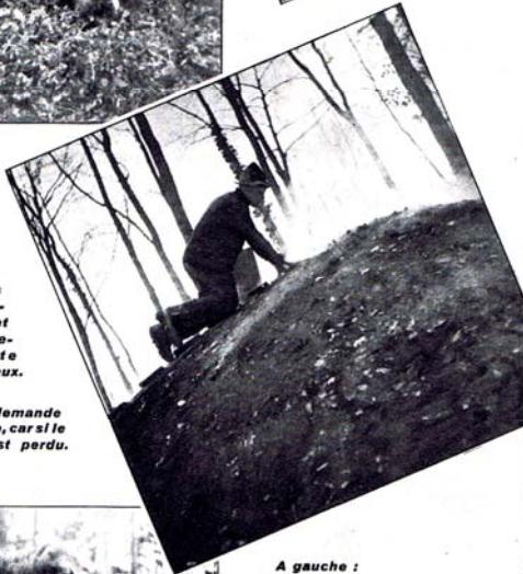
A droite : La meule demande une surveillance vigilante, car si le bois prend feu, tout est perdu.