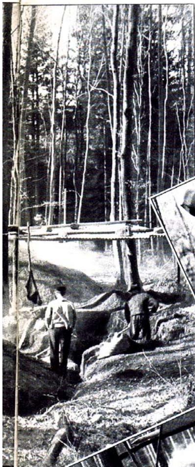
A droite : Un écriteau a été cloué contre un arbre : «Ecole de charbonniers d'Ollon».